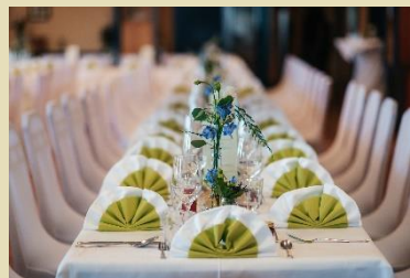
Tischdeko für den schönsten Tag im Leben

Unser Saal ist aber nicht nur für romantische Hochzeiten geeignet, sondern auch für stimmungsvolle Familienfeiern und informative Versammlungen oder Seminare und nicht zuletzt auch für Livemusik und Kabarettabende, wie demnächst