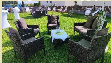
Loungebereich und Beachsessel im Hochzeitsgarten

Nachstehend ein paar Eindrücke von unseren Hochzeitsfeiern.